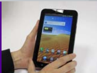
Großes und gut lesbares Display

Mobiles Endgerät z.B. Samsung Galaxy Tab mit AIS Easy Paket Software