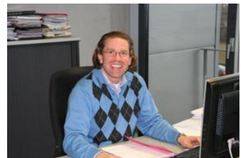
Spedition Brucker GmbH, Aalen

„Ich setze das AIS System seit drei Jahren ein, weil ich damit viel Zeit und Geld spare! Und meine Mitarbeiter nutzen es gerne, weil alles einfacher geht!“